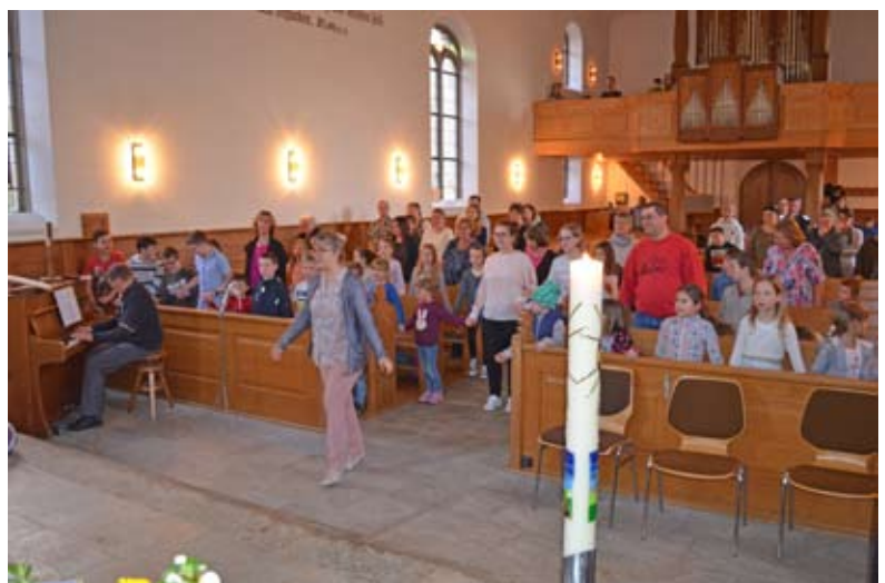
Abschlussgottesdienst Kinderwoche 2018